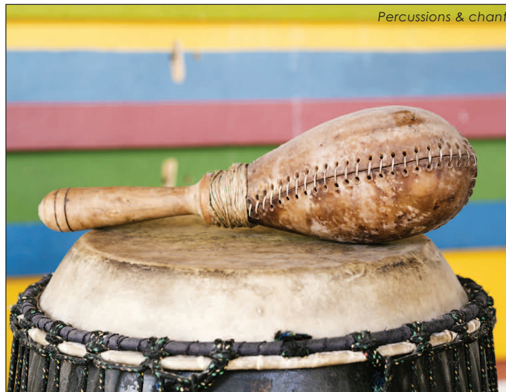
Percussions & chant

Un stage de percussions et de chant basé sur des rythmes africains et afro-cubains avec différents instruments (percussions à main et à la baguette)