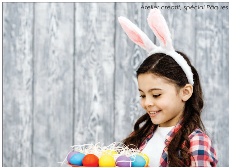
Atelier créatif, spécial Pâques

Créer des masques, des cartes postales, des pantins, des décorations tout en couleurs, des portes clés en pâtes fimo, tel est le programme proposé.